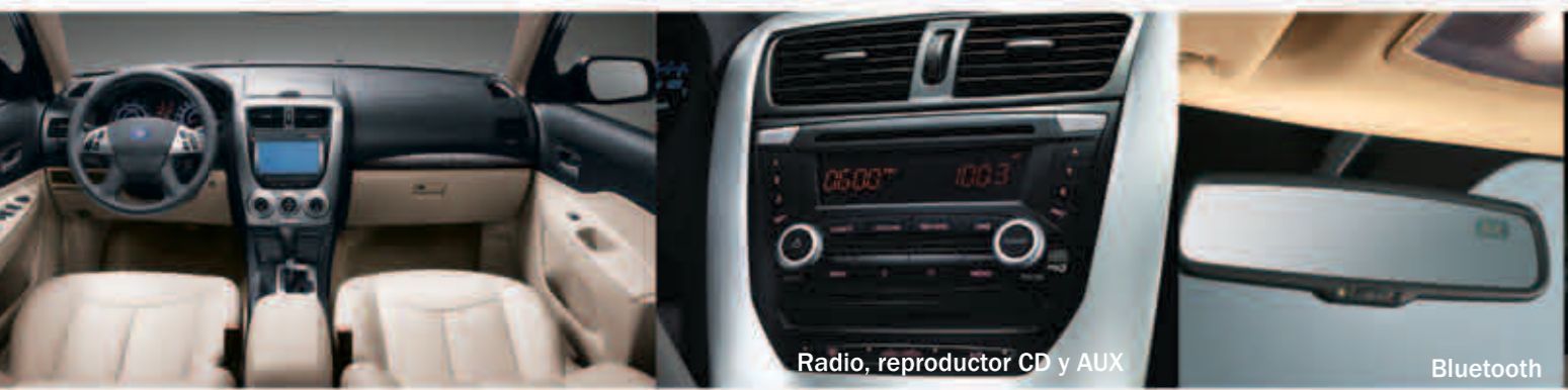
Radio, reproductor CD y AUX