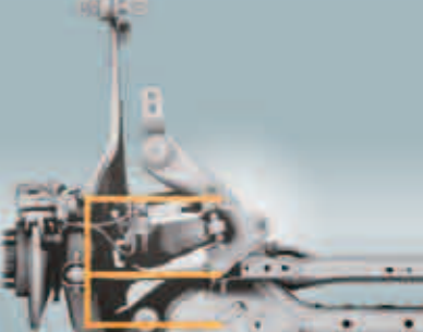
Suspensión trasera independiente multi-link de tipo-E con barra estabilizadora