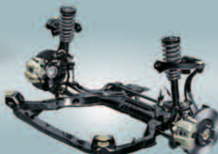
Suspensión frontal independiente de doble horquilla con barra estabilizadora

La combinación de suspensión frontal independiente de doble horquilla con barra estabilizadora, con suspensión trasera independiente multi-link de tipo-E con barra estabilizadora, le confieren control y estabilidad superiores al Besturn B50.